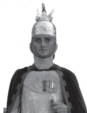
Laia kaj Robafaves

Ni celas renkontiĝi kiel eble plej multaj esperantistoj, kaj kunigi la novajn esperanto-lernantojn kie ni povos: